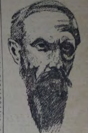
Doctor O. DECROLY

¿las dificultades de la lengua"; sin pensar en analizar ni en seriar los ejercicios se hace comprender e imitar poco a poco. Si este milagro de la adquisición del lenguaje por el procedimiento maternal — que no tiene nada de formal ni de conscientemente lógico, pero que es lógico sin embargo, — al este milagro fuera mejor conocido por los educadores, verían probablemente más